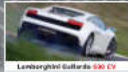
Lamborghini Gallardo 500 CV