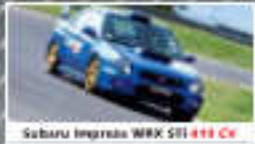
Subaru Impreza WRX STI 411 CV