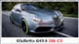
Giulietta G43 186 CV