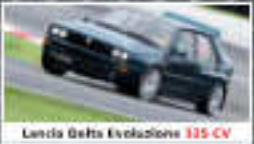
Lancia Delta Evoluzione 135 CV