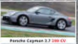
Porsche Cayman 2.7 300 CV

VEHICLE - AMAQ 2011 - Riproduzione in Abbinamento Pubblicità - D.L. 30/03/2002 (art. 1, comma 1) - D.C. Roma - Distribuzione: C.D.M. Centro Distribuzione Media - Roma - Tel. 06/5200400 - www.europa-sport.it